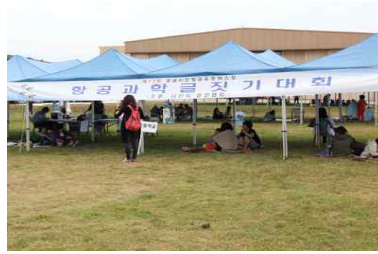
<항공과학 글짓기 대회>