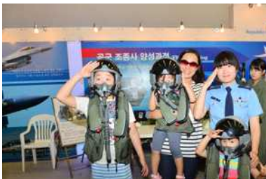
<대한민국 공군 홍보관>