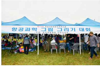
<항공과학 그림그리기 대회>