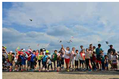
<관람객 이벤트-종이비행기 멀리 날리기>