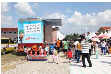
<소방서 119 안전체험 차량 >

공공기관 홍보, 지역특산품 홍보 및 판매, 먹거리 부스, 엑스포기념품 판매, 관람객 이벤트 등