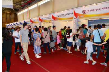
<항공 교육기관 및 진학상담>