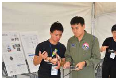
<로봇 무인기 체험>