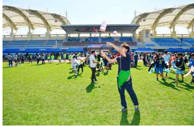
<전국 모형항공기 대회>