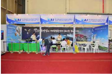
<항공 산업체 홍보>