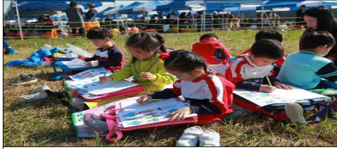
항공과학 그림그리기 대회