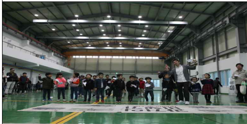
종이비행기 파일럿 교실