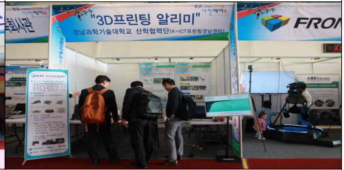
항공우주관련 교육기관 홍보관