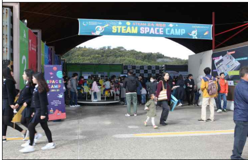
STEAM SPACE CAMP (융합인재교육)