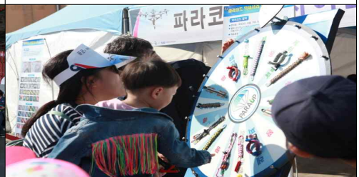
파라코드 업사이클링 체험