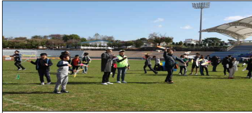
전국 모형 항공기 대회