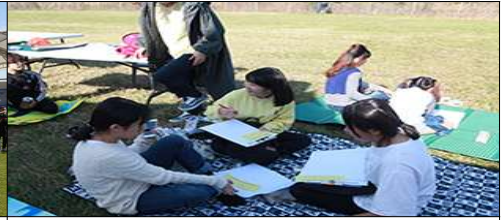
항공과학 글짓기 대회