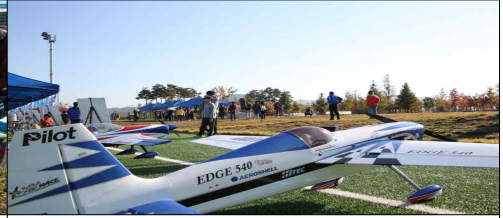
국제 PAV 기술경연 대회