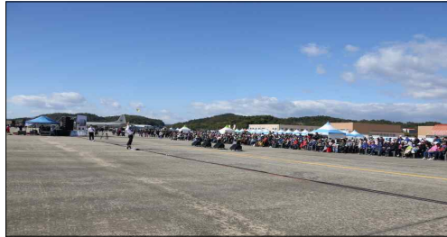
종이비행기 국가대표팀 시범