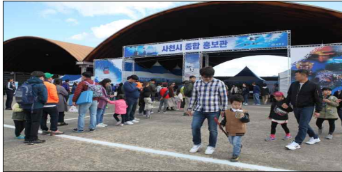
사천시 종합 홍보관