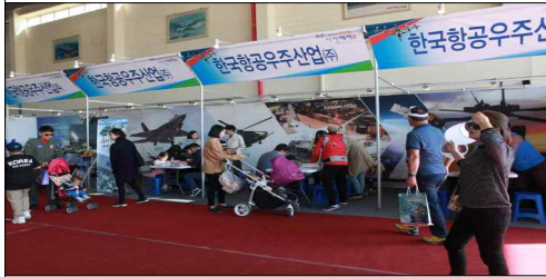
항공우주관련 업체 홍보관