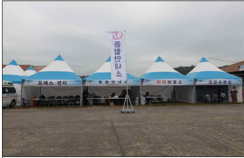
종합안내소, 미아보호소 등